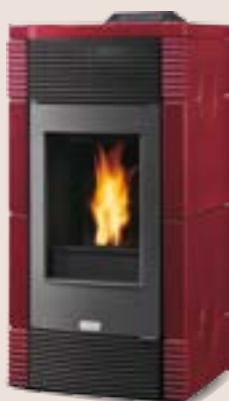
Finitura Rosso Bordeaux