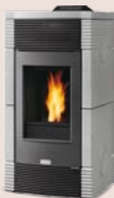
Finitura Bianca (Sale e Pepe)

VIENNA E' DISPONIBILE IN QUATTRO FINITURE: