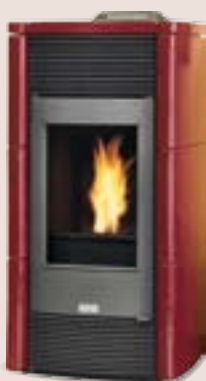
Finitura Rosso Bordeaux