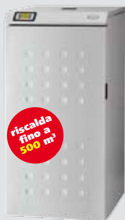
VITTORIA 20 kW