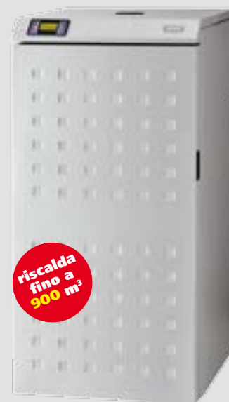
VITTORIA 34 kW