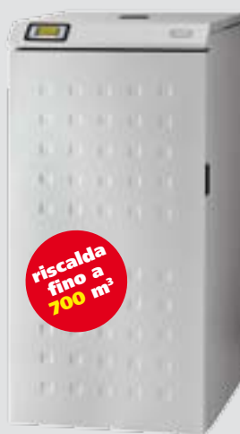
VITTORIA 26 kW